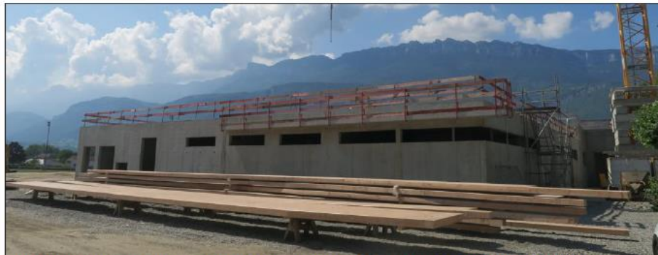
Les travaux de gros œuvre, lancés au début de l'année, sont terminés. Le bâtiment sera mis hors d'eau et hors d'air à l'automne prochain après la pose de la charpente et des vitres qui doit intervenir ces prochaines semaines.

C'est trop peu sur un territoire de 100 000 habitants : en 2014 déjà, le Diagnostic territorial ap-